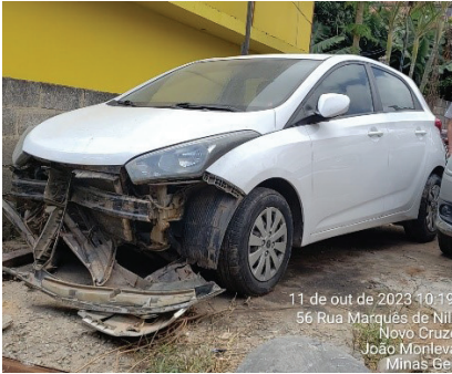
11 de out de 2023 10:19 56 Rua Marquês de Nilza Novo Cruzeiro João Monlevade Minas Ger

BO: 2023-045749089-001 DATA: 29/09/2023 VALOR DO DANO: R$ 13.016,27 PARTIC. OBRIGATÓRIA: R$ 2.043,45 VALOR RATEADO: R$ 10.972,82 VALOR POR COTA: R$ 1,35